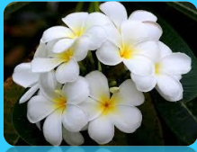
ดอกฉันทนา